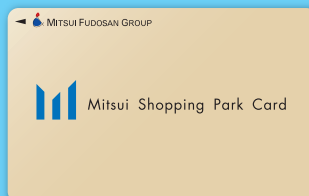
三井ショッピングパークポイントカード

※ラゾーナ川崎プラザポイントカード、ラゾーナ川崎プラザカード 《セゾン》も対象となります。