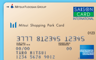
三井ショッピングパークカード《セゾン》