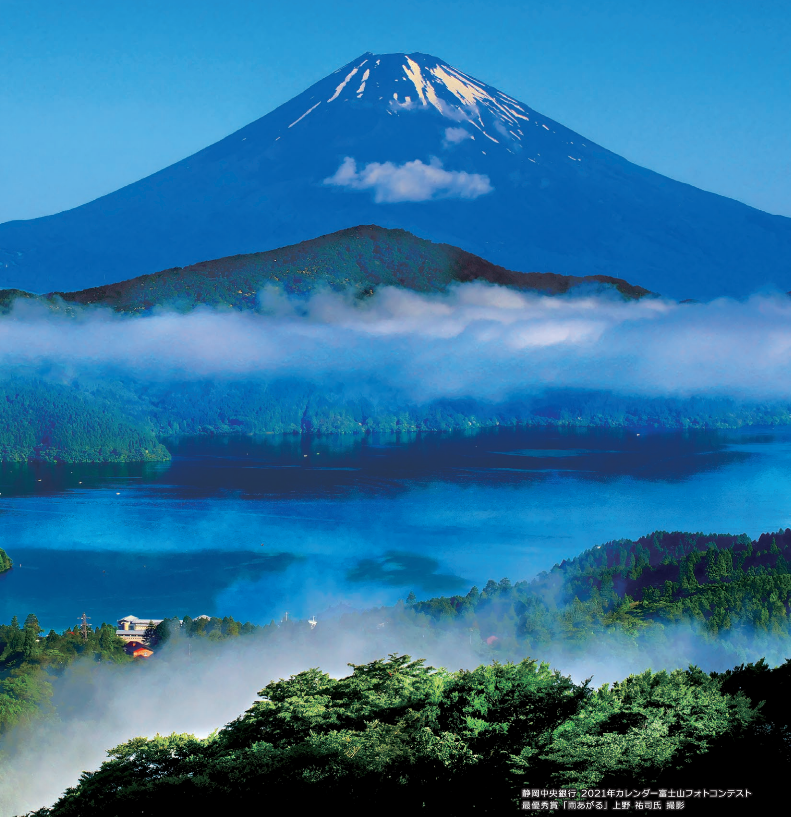
静岡中央銀行・2021年カレンダー富士山フォトコンテスト 最優秀賞「雨あがる」