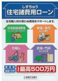
住宅取得時の様々な諸費用に対応無担保で最大500万円