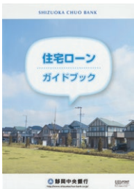
（しずちゅう）の住宅関連ローンの総合ガイドブック