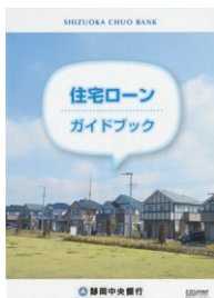
（しずちゅう）の住宅関連ローンの総合ガイドブック