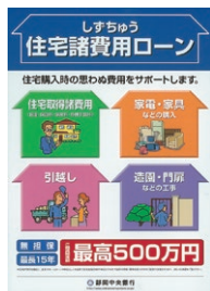
住宅取得時の様々な諸費用に対応無担保で最大500万円