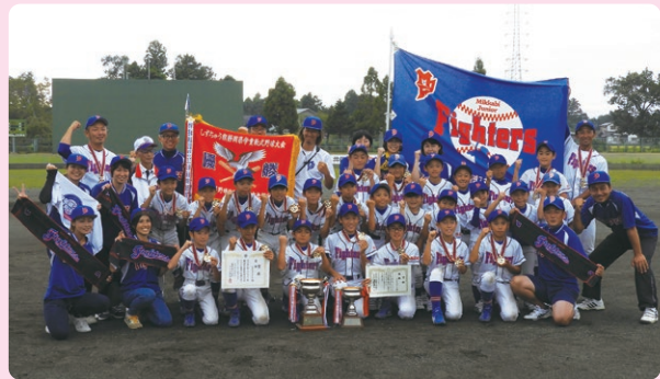
第7回大会優勝チーム 三ヶ日ジュニアファイターズ

また、同予選会を対象に「はつらつプレーフォトコンテスト」を実施し、入賞作品のホームページ上での公表や、当行本支店での写真展も開催しております。