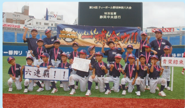
第24回大会優勝チーム 青葉緑東リトルリーグ

今後も、学童の健全な成長を応援し、「お客様・地域社会と共に発展しベストパートナーとして信頼される銀行」を目指してまいります。