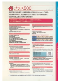
担保不足分や諸費用に対応有担保で最大500万円