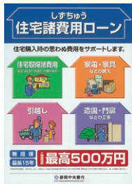
住宅取得時の様々な諸費用に対応無担保で最大500万円