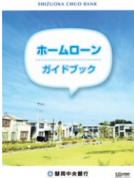
〈しずちゅう〉の住宅関連ローンの総合ガイドブック