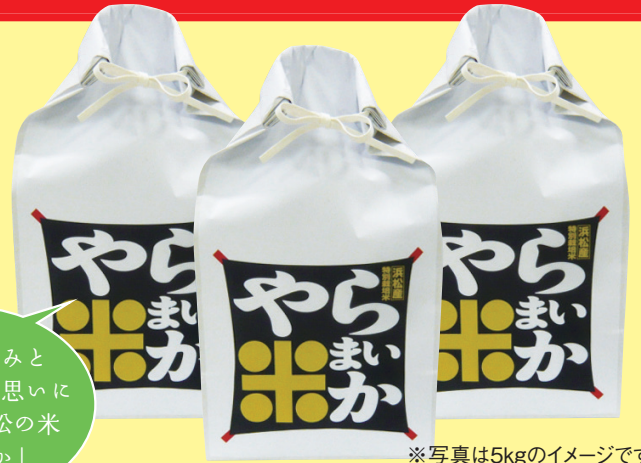
※写真は5kgのイメージです。