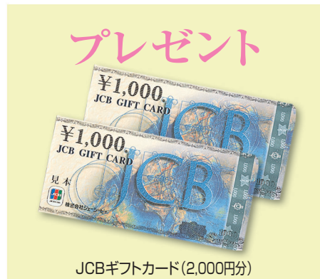
JCBギフトカード(2,000円分)

年金振込を当行にご指定いただいたお客様には「しずちゅう21世紀年金クラブ」の各種特典をご利用いただけます。